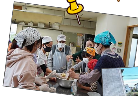
クリスマスのクッキー作り

「みんなの食堂」は、わたしたちと遠藤地区社会福祉協議会が協力して開催しており、子どもたちに野菜の収穫体験や調理体験・見学等をおし、生きる力を育んでもらいたいと考えています。