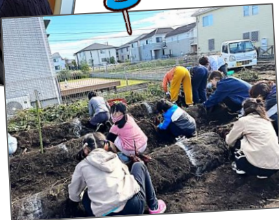
秋のさつまいも堀り