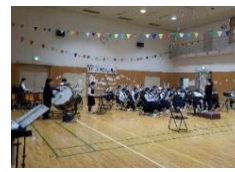
片瀬中学校の吹奏楽もありました