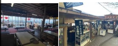
海が一望できる店内 昔ながらの店構えが迎えてくれます