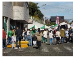
しおさいセンターの模擬店にもぎわいました