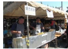
4年ぶりに焼きそばも実演販売されました