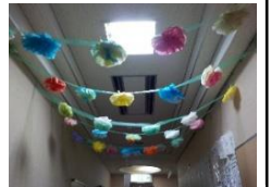
しおさい荘のみなさんの手作りのお花も

で覆われているのは、人の手が加わっていない寺社地が多いことや、温暖で湿潤な気候であるためだそうです。森林区分では常緑照葉樹林にあたります。