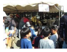
本館の模擬店会場は常に、にぎわっていました