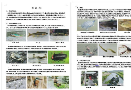
配布資料 引地川に生息する生物について