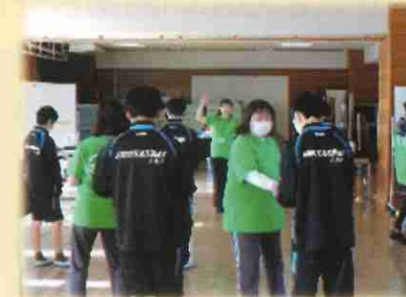
地域連携活動体験